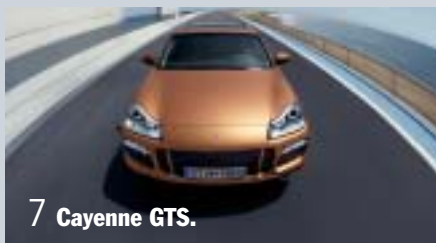
7 Cayenne GTS.