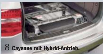
8 Cayenne mit Hybrid-Antrieb.