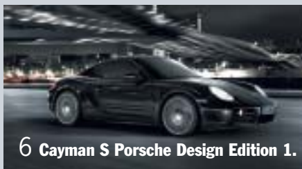
6 Cayman S Porsche Design Edition 1.