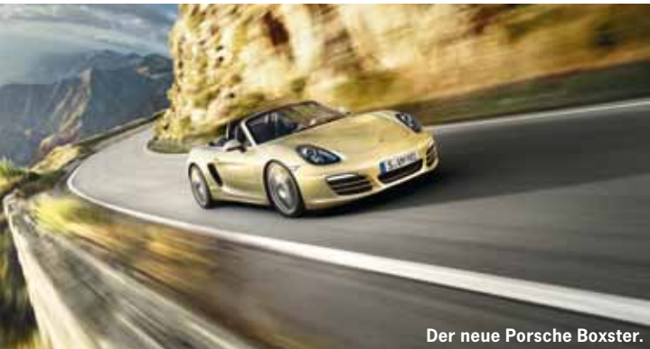
Der neue Porsche Boxster.